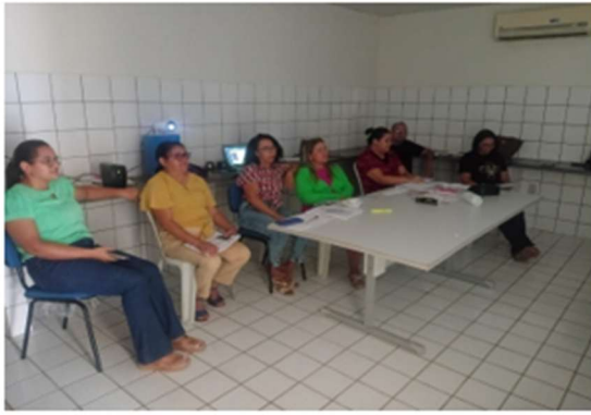
Capacitação para certificação mês de julho