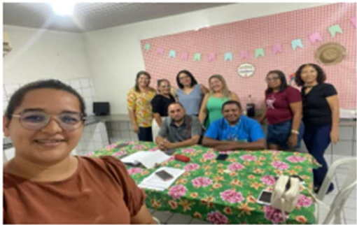
Reunião mês de junho