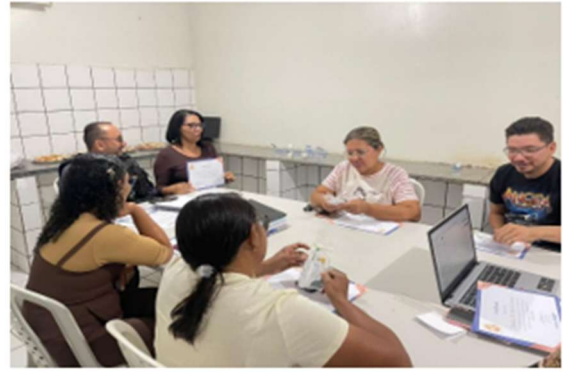
Reunião de maio