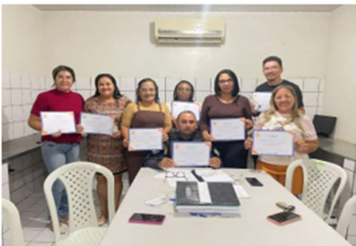
Reunião mês outubro