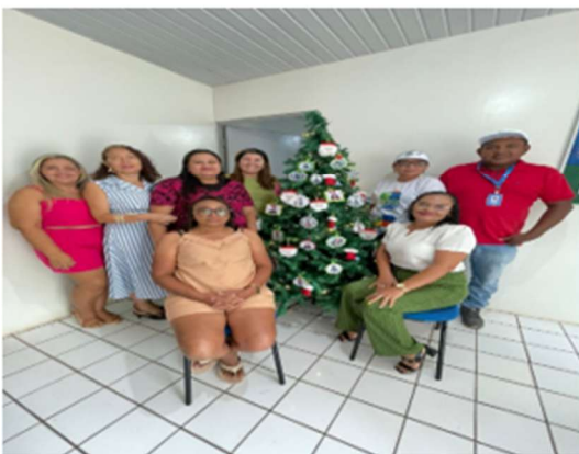
Reunião mês de dezembro