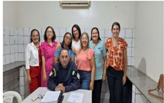
Reunião mês de setembro