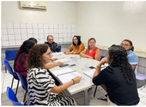
Reunião de abril