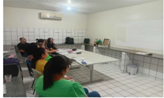
Capacitação para certificação mês de julho