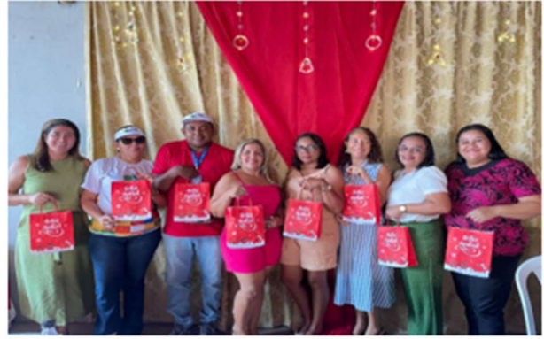
Reunião mês de dezembro