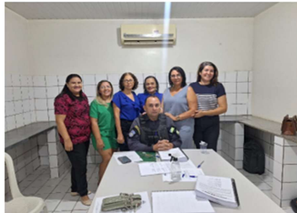
Reunião mês de agosto